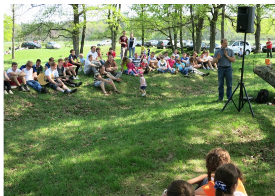
Молодёжное общение. (Брянск)

Бог даст, мы ещё вернёмся в Беслан для проповеди Евангелия!