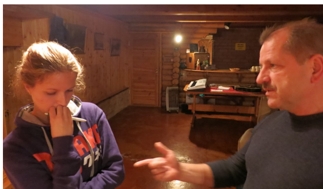
Очень важны личные беседы с молодыми людьми.