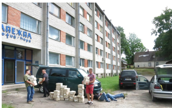
Собираемся в миссионерскую поездку.