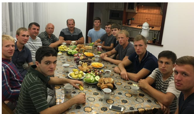
Общение с будущими миссионерами. (Майкоп)