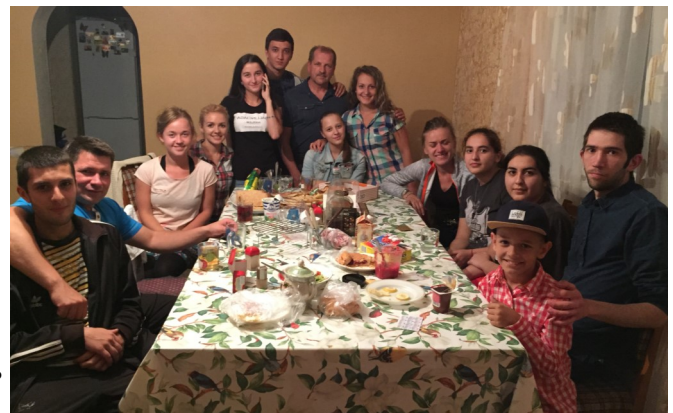
Благословенные общения в семьях. (Беслан)

Друзья, мы благодарим всех, у кого горит сердце поддерживать наше служение, которое поручил нам Господь. Наша миссионерская группа готовится и в этом году провести лагерь на Кавказе (г.Беслан), а также посетить ещё некоторые места в России с проповедью Евангелия. Новые законы и политическая обстановка там очень осложняет нашу духовную работу, но мы решили трудиться, пока будет хоть какая-то возможность. В мае мы с небольшой группой поедem в Беслан, чтобы поддержать и ободрить там наших молодых друзей, которые идут к Богу или уже уверовали в Него. Мы будем посещать их семьи и проводить с ними общения.