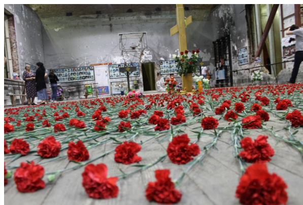
А в Беслане боль не лечит даже время.