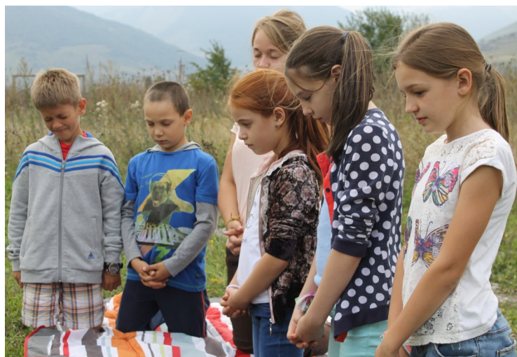
Эти дети умеют молиться. (Беслан)