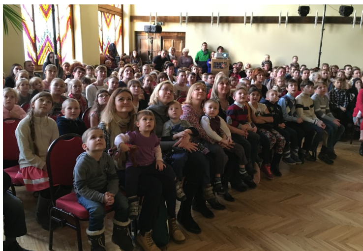
Дай Бог, чтобы эти дети стали христианами. (Эстония)