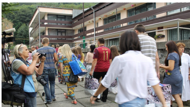
Для общения с беженцами из Украины мы идём с подарками и со словом от Бога. (Осетия)

служении мы часто попадаем в семьи, где много детей, где есть инвалиды – там немало материальных нужд. Посещая такие семьи, мы всегда имеем с собой продукты, одежду, обувь, детские игрушки, вещи для школы. Продукты мы можем купить на месте, а всё остальное везём с собой из Америки, т.к. здесь не в сезон качественные вещи можно купить довольно дёшево. Мы заранее ищем такие возможности, всё это закупаем и потом берём с собой. Родители бывают очень благодарны, когда видят внимание и заботу чужих людей о их семьях. Но мы всегда призываем их благодарить не нас, а Господа. Это бывает хорошей проповедью о любви Божией через наши дела и тоже является частью нашего служения, в котором и вы участвуете своими пожертвованиями. После того страшного теракта в Беслане немало молодых ребят и девушек остались инвалидами, некоторые вообще не могут передвигаться и это на всю жизнь. Когда мы посещаем их, наши сердца сжимаются от боли и некоторые наши молодые миссионеры не выдерживают и начинают плакать от жалости к этим людям. Мы в следующих наших листках постараемся рассказать о их горе и о тех, кому из них нам удалось помочь в их лечении, благодаря вашим молитвам и финансам. Это стало большим свидетельством о любви Божией для этих людей. Кроме Беслана мы стараемся и в других местах проповедывать о Господе.