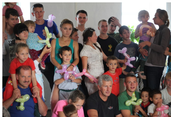
Рязанская область, детский дом.

служении мы часто попадаем в семьи, где много детей, где есть инвалиды – там немало материальных нужд. Посещая такие семьи, мы всегда имеем с собой продукты, одежду, обувь, детские игрушки, вещи для школы. Продукты мы можем купить на месте, а всё остальное везём с собой из Америки, т.к. здесь не в сезон качественные вещи можно купить довольно дёшево. Мы заранее ищем такие возможности, всё это закупаем и потом берём с собой. Родители бывают очень благодарны, когда видят внимание и заботу чужих людей о их семьях. Но мы всегда призываем их благодарить не нас, а Господа. Это бывает хорошей проповедью о любви Божией через наши дела и тоже является частью нашего служения, в котором и вы участвуете своими пожертвованиями. После того страшного теракта в Беслане немало молодых ребят и девушек остались инвалидами, некоторые вообще не могут передвигаться и это на всю жизнь. Когда мы посещаем их, наши сердца сжимаются от боли и некоторые наши молодые миссионеры не выдерживают и начинают плакать от жалости к этим людям. Мы в следующих наших листках постараемся рассказать о их горе и о тех, кому из них нам удалось помочь в их лечении, благодаря вашим молитвам и финансам. Это стало большим свидетельством о любви Божией для этих людей. Кроме Беслана мы стараемся и в других местах проповедывать о Господе.