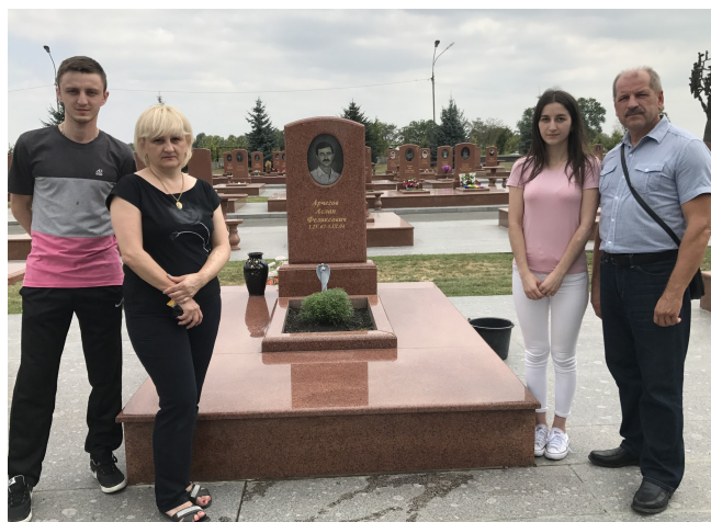
Линда с мамой и братом у могилы папы