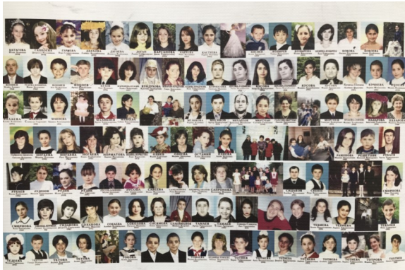
1 сентября 2004 г. Они не вернулись из школы домой.

Ты ободришься и смело делай Господне дело, Делай его, как надо, в небе получишь награду Рядом с героями веры встанут миссионеры!