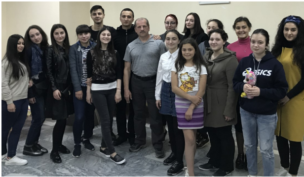
А этим ребятам посчастливилось выжить.