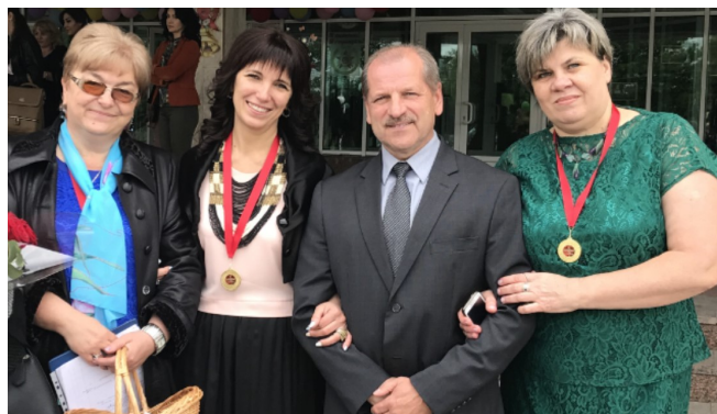
С учителями школы г. Беслана. Они выжили в теракте в 2004 году.