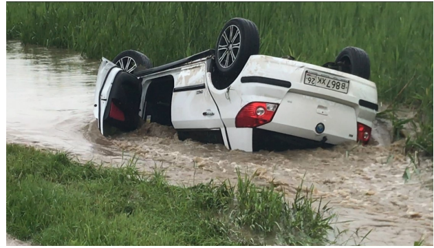
По дороге на Кавказ много опасностей.

Дорогие друзья, мы очень хотим, чтобы и в этом году Бог помог нам исполнить то служение, которое Он нам поручил. Ваша молитвенная, духовная и материальная поддержка будет для нас большим благословением. Пусть Сам Господь воздаст вам за ваш труд, который вы делаете во имя Его и для Его славы. Пусть ещё многие люди узнают, что есть спасение от вечной гибели и есть вечный Бог, который их любит и ждёт. Пусть каждый из нас задаст себе этот вопрос: «А чем я послужил в деле проповеди Евангелия?». Да благословит вас Господь! Ему слава во веки!